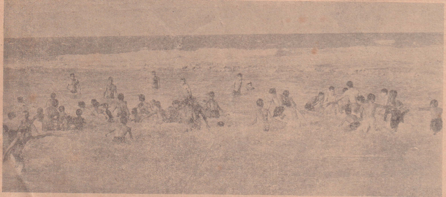
‘மார்மைட் நீச்சல் பழகும்’ இயக்கத்தின் முதலாவது பாடம், தன்னம்பிக்கையை ஊட்டி, நீரின் பயத்தைப் போக்குவதாகும். அண்மையில் நடாத்தப்பட்ட யாழ்ப்பாணம் வை. எம். லி. ஏ. ‘நீச்சல் பழகும்’ இயக்கத்தில் கலந்து கொண்ட மாணவர்கள், பயிற்சியாளர்களின் கண்காணிப்பின்கீழ், மகிழ்ச்சியுடன் நீரில் துள்ளி விளையாடுவதை இங்கு காணலாம். இப்படி விளையாட்டின்மூலம், நீருடன் நட்புக் கொள்ள மாணவர்கள் பழகுகிறார்கள்.