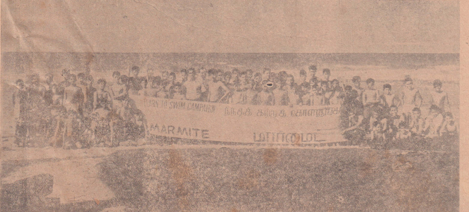
யாழ்ப்பாணத்தில் ‘மார்மைட் நீச்சல் பழகும்’ இயக்கத்தின் முதலாவது பாடம் ஆரம்பமாகுமுன், நீச்சல் சங்கப் பயிற்சியாளர்களும், யாழ்ப்பாணம் வை. எம். லி. ஏ. உத்தியோகத்தர்களும், 75 மாணவர்களுடன் மகிழ்ச்சியுடன் காணப்படுகிறார்கள்.

பதுக்கல் பொருட்கள் கைப்பற்றப்பட்டன கொத்தலை, திங்கை கொத்தலையைச் சேர்ந்த சங்கிலிபாலம், ரொஜ்கம், பூண்டலோயா, ஆகிய இடங்களில் நுவலெலி உணவுக் கட்டுப்பாட்டகாரியால் நடத்தப்பட்ட திடீர் வேட்டையில் மிகுதியாக, அரிசி, கொத்தல் ஆகியபொருட்கள் கைப்பற்றப்பட்டன.