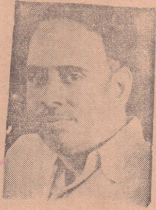
சென்னை மார்ச் 15

தென்மாநில ஒத்துழைப்பின் அவசியத்தையும் வலியுறுத்துகிறார்