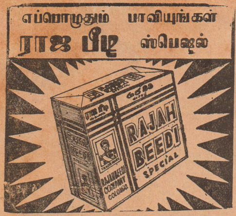
ராஜ பீடி கம்பெனி, கொழும்பு-14