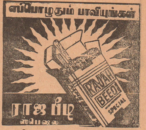
ராஜ பீடி கம்பெனி, கொழும்பு-14

தேசிய தினசரி National Tamil Daily மலர் 9 [15-2-67] இதழ் 5 பாபவ 2084 3 ஜூன் 4 புதன்கிழமை