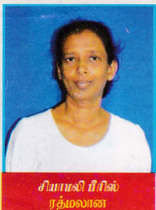
சியாமலி ரீனில் ரத்மலான

3 வருடத்திற்கு முன்னர் எனது இடது மார்பகத்தில் கட்டிகள் ஏற்பட்டு நான் அதற்காக வைத்தியப் பரிசாரம் பெற்றுக் கொண்டேன். வைத்தியப் பரிசீலனைகளில் பிறகு அது புற்று நோயென வைத்தியர்கள் தீர்மானித்தார்கள். சத்திரச் சிகிச்சை மூலமாக அதை அகற்றினார்கள். அதன் பிறகு ஒரு வருடத்தின் பின்னர் என் இடது கமக்கட்டில் தேசிக்காய் அளவில் சிறிய கட்டியொன்று ஏற்பட்டது. அதையும் சத்திர சிகிச்சையினால் அகற்றினார்கள். அதன் பிறகு ஒரு வருடத்திற்கு பின்னர் மீண்டுமாக அதே போன்று கட்டியொன்று அதே இடத்தில் ஏற்பட்டது.