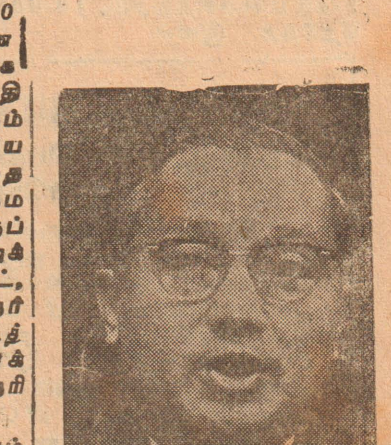
வியட்னாமில் சமாதானம் ஏற்படக்கூடிய சந்தர்ப்பங்கள், கடந்த நாட்கு வடவருடிகளிலும் பாரிக்க இப்போதுதான் அதிக அளவில் அநுகூலமாக அமைந்துள்ளதாகவும் யூ தாண்ட் கூறினார்.

ஹோக், ஏப்ரல் 10 - வியட்னாமில் சமாதானத்தை நினைநாட்டுமுமாக விரைவில் அமெரிக்கப் பிரதிநிதிகளுக்கும் வடவியட்னாம் பிரதிநிதிகளுக்கும் மிடையே பூர்வாங்கப் பேச்சுவார்த்தைகள் நடக்குமென்பதில் தமக்கு அதிக நம்பிக்கை இருப்பதாக ஐ. நா. பொதுக் காரியதரிசி யூ தாண்ட், தமது முன்னாள் நெதர்லாண்ட்ஸ் விஜயத்தை முடித்துக்கொண்டு நியூயோர்க் திரும்பமுன்னர் இங்கு தெரிவித்தார்.