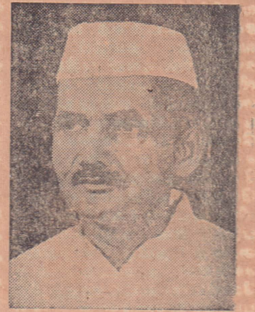
அங்கு முதன் முதலாகச் சென்று அஞ்சலி செலுத்தியவர் சாஸ்திரியும் ஒருவர்.

புதுடில்லி, ஒக். 3 முன்னாள் இந்தியப் பிரதமர் திரு. லால்பகதூர் சாஸ்திரியின் பிறந்த தினமாகிய நேற்று, அவருக்கு நாடெங்கும் மக்கள் அஞ்சலி செலித்தினர்.