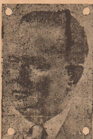
திச்சயமாகத் தெரிவித்துள்ளது. ஆனால் இதுபற்றிய இரத்தி முடிவைத் தரப்படும் திரும்பிய பிறகு டிட்ளோ எட்டுப் பரபரப்பைப் பொதுவாக நம்பப்படுகிறது.

மாஸ்கோ, ஏப். 30 நேற்று மாஸ்கோ வந்த சேர்ந்த யூகோஸ்தாவிய ஜனநாயக மாநாட்டில் சந்தித்தது. இது நாடுகளின் சம்பந்தப்பட்ட தொடர்புகள் பற்றியும், சர்வதேச கம்யூனிஸ்ட் கட்சிகளிடையே யான கொள்கை வித்தியாசங்களை, பிரச்சினைகளை பற்றியும் பேச்சுவார்த்தைகளை நடத்தியுள்ளார்.