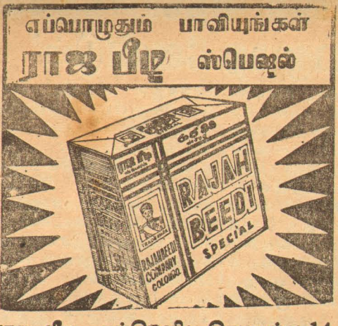
ராஜ பீடி கம்பெனி; கொழும்பு-14