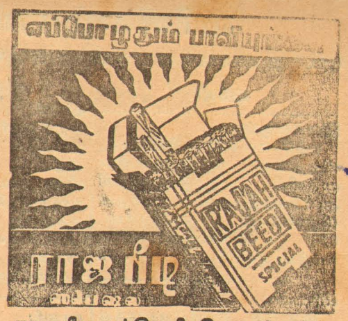
ராஜ பீடி கம்பெனி, கொழும்பு-14

தேசிய தினசரி National Tamil Daily மலர் 10 [16-3-68] இதழ் 35 யாழ்ப்பாணம் பிலவங்க பங்குனி 3 ஜூன் 16 சனிக்கிழமை