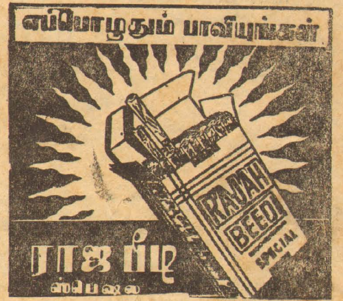
ராஜ பீடி கம்பெனி, கொழும்பு-14

தேசிய தினசரி National Tamil Daily மலர் 9 [1-9-67] இதழ் 202 யாழ்ப்பாணம் பிலவங்க ஆவ. 16 ஜ. அவ. 25 வெள்ளிக்கிழமை