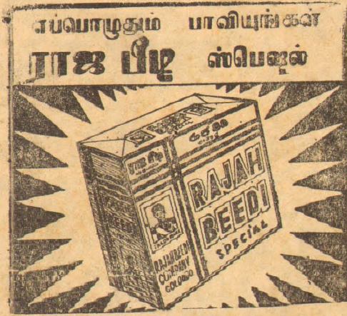
ராஜ பீடி கம்பெனி; கொழும்பு-14