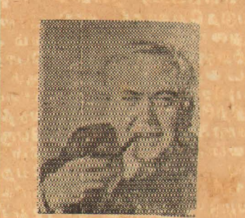
பிரிட்டிஷ் பிரதமர் இந்தியாவுக்கு விஜயம்

வெள்ளையற்ற நாடாகும். தென் ஆபிரிக்காவில் மாலா வியின் முதலாவது பிரதிநிதியாக ஒரு ஐரோப்பியர் கடமை யாற்றுவாரென்றும் ஆனால் விரைவில் அவருடைய இடத்துக்கு ஒரு ஆபிரிக்கர் நியமிக்கப்படுவாரென்றும் மாலாவி அறிவித்துள்ளது.