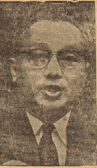
வெளியுறவு மந்திரி*ள் கூட்டம்

அப்பாவி மக்களின் நலன்கருதி, வேற்றுமைகளைக் கைவிடும்படி யூ. தாண்ட் இஸ்ரேல், அரபு நாடுகளைக் கேட்டுக்கொண்டார். மேற்கு ஆசியாவுக்கு ஐ. நா.வின் விசேஷ பிரதிநிதி ஒருவரை அனுப்புவதற்குச் சபையின் உடனடியான அங்கீகாரத்தை யூ. தாண்ட் கோரினார். வியட்னாம் போர் பற்றி அவர் குறிப்பிடுகையில், அங்கு நடைபெறும் போர் பயங்கரமான வளர்ச்சி அடைந்து வருவதாகவும், பிரமிக்கத்தக்க அளவில் ஆட்சேதம் இடம்பெறுவதாகவும் வருத்தம் தெரிவித்தார். வியட்னாம் சமாதானத்துக்கு வழிவகுக்கும் சில முன்நடவடிக்கைகளை ஐ. நா. எடுக்கலாம் என அவர் ஆலோசனை தெரிவித்தார்.