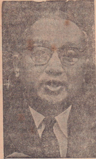
இரணுவ வெற்றி கிஷையாது

நியூயோர்க், ஜூன் 19 வியட்னாம் போரை விஸ்தரிப்பதற்காக, அமெரிக்கா, வடவியட்னாம் இருதரப்பினரிடமிடம் ஐ நா. பொதுக்காரியத்தர்ப்பு யூ தாண்ட் குற்றச்சாட்டியுள்ளார். ஐ நா. நிரூபிக்கும் சமீபத்தில் நியூயோர்க் நகரில் உரையாற்றுகையில், யூ தாண்ட் இவ்வாறு குற்றம் சுமத்தினார். பாரிஸ் பேச்சுவார்த்தைகள் மீண்டும் ஆரம்பமாகும் வட்டத்தில் இவ்வாறு குற்றச்சாட்டிய ஐ. நா. பொதுக்காரியத்தர்ப்பு யூ தாண்ட் பேச்சுவார்த்தைகள் இன்னும் நீண்டகாலத்திற்கு இடம் கொடுப்பதில்லை என்று குறிப்பிட்டார்.