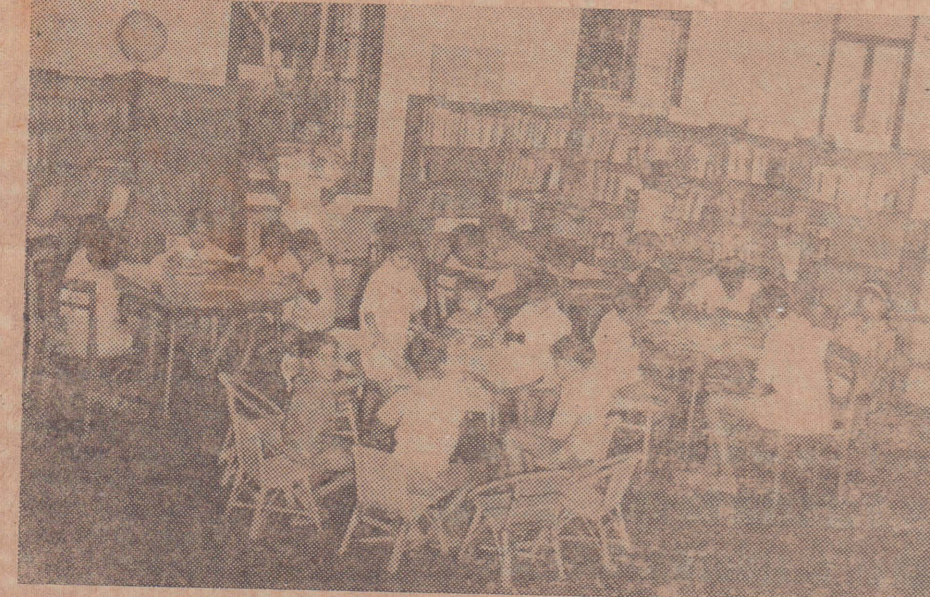
சுற்றுலாப்போன சின்னஞ் சிறிய குழந்தைகள் சிறுவர் நூல் நிலையத்தில் அடங்கி யொடுக்கியிருந்து அறிவை வளர்க்கும் அருமையான காட்சி.

ஒரு சமயம் இருந்தால், அதைக் கொண்டு திரும்பித் திரும்பித் தேடிக்கொள்ள வேண்டியதில்லை. மேலும் தேவை ஏற்படாது!