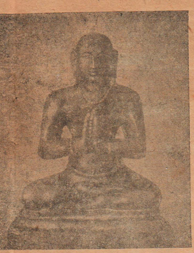
புள்ளாரடி யாரவர் வான்புகழ்! திருத்தொடரும் நிலவி உலகெலாம்.