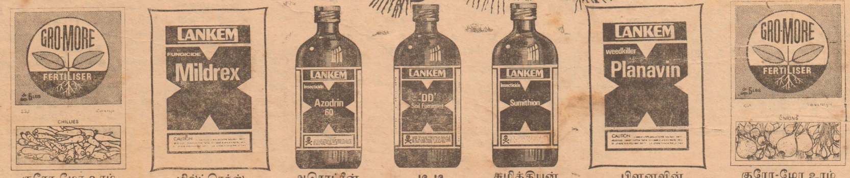
குரோ-மோ உரம் மில்ட்ரெக்ஸ் அசொடர்ன் டி.டி. சுமித்தியன் பிளனவின் குரோ-மோ உரம்