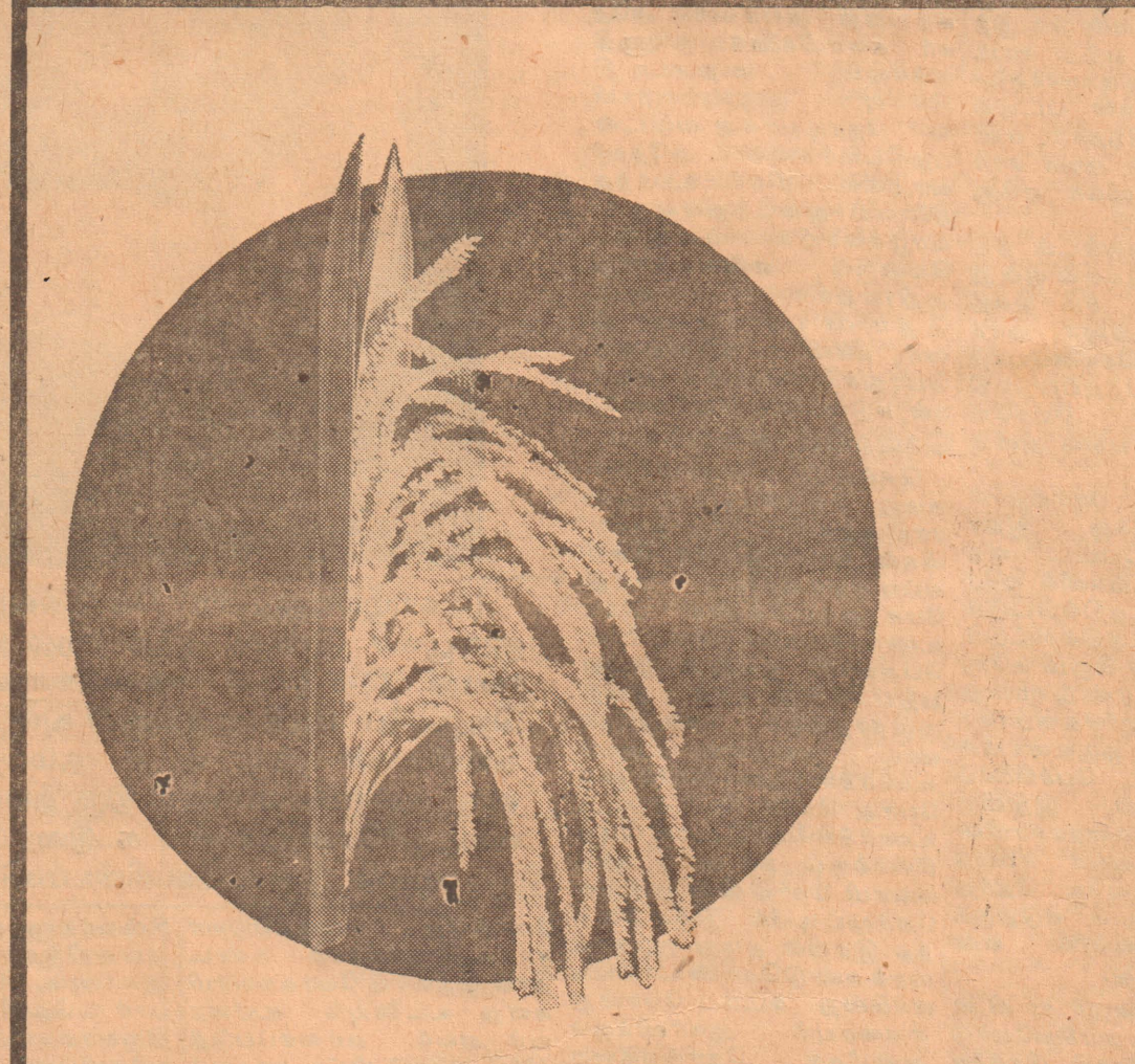
உங்கள் மண் பொன் விளையும் பூமியாக வளம் பெற...

சுமார் முக்கால் நூற்றாண்டு காலமாக இலங்கையின் விவசாயத்துறைக்கு அதிசிறந்த உர வகைகள், விவசாய ரசாயனப் பொருள்கள், தெளி கருவிகள் ஆகியவற்றை வழங்கி, இலங்கை மக்களின் காணி பூமிகளை வளமாக்கி, அவர்கள் அதிக விளைச்சலையும் அபரிமித இலாபத்தையும் பெறத் துணை நின்று வரும் முன்னோடி ஸ்தாபனம் பவர்ஸ். நீங்களும் உங்கள் மண்ணை வளமாக்கி செழிப்பான விளைச்சலைப் பெற பவர்ஸ் பொருள்களையே பாவிப்புகள்.