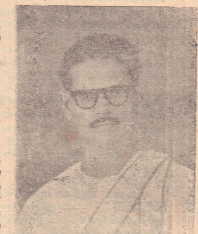
இருக்கப்போகிறது. 'சேவையில் ஊறியவர்களுக்கு அதிக ஓய்வு இருப்பதில்லை! - குருவி

ஆங்கில ஆசிரியர் இல்லை சுழிபுரம், திங்கள் வட்டுக் கோட்டைத் தொகுதியிலுள்ள அதே பாடசாலைகளில் ஆங்கில பாடம் கற்பிக்கும் ஆசிரியர்கள் இல்லையென அறியப்படுகிறது.