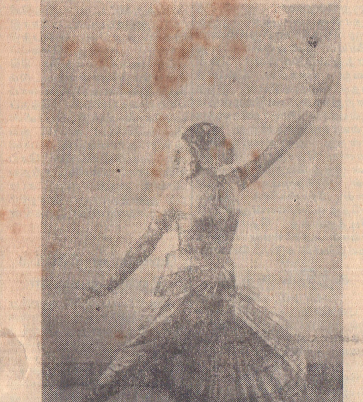
Digitized by Noolaham Foundation. www.noolaham.org

யாழ்ப்பாணம், திங். சம்பவம் நடந்ததினம் எதிரி, நாகனுடன் பேச்சுப் பட்டுக்கொண்டிருந்தார். இறந்தவர் நாகனுக்குக் கிட்டப்போனார். அப்போது எதிரி 'ஆட்டுக்கடா வெட்டும் கத்தியால் இறந்தவரின் தோளில் வெட்டினார். இறந்தவர் கொஞ்சத்தூரம் ஓடிப்போய் விழுந்தார்.' இளவாலை கொலைவழக்கில் சாட்சியமளித்த கந்தன் மாணிக்கம் மேற்கண்ட வாறு கூறினார். இவ்வழக்கு நேற்றுக்காலை வடபகுதி அரசைஸ்கோர்ட்டில் நீதியரசர் ஓ. எல். டி. கிரெஸ்டர் முன்னிலையில் விசாரணைசெய்யப்பட்டது. இவ்வழக்கில் இளவாலை யில் 68-ம் ஆண்டு மேமாதம் 14-ந் தேதி கதிர்வந்தம்பர் என்பவர், சின்னப் பொடியைக் கொலை செய்ததாக குற்றம் சாட்டப்பட்டிருந்தது. எதிரிசார்பில் அட்வகேட் எஸ். ஆனந்தகுமாரசாமி, புறகட்டர் சி. ஆறுமுகத்தின் அனுசரணையுடன் ஆஜரா ளார். எதிரிக்காக அட்வகேட் சி. ஆறுமுகம் நியமிக்கப்பட்டார். அவைகளை நீக்க முயற்சி எடுக்க வேண்டும் என்பதே எமது நோக்கம் என்றும் சிங்கள மக்கள் பற்றித் தமிழ்மக்களிடையே உள்ள அவநம்பிக்கையை அறவே அகற்றத் தாம் பாடுபட்டு வருவதாகவும் அவர் சுட்டிக்காட்டினார். திரு. ரி. பி. சுபசிங்கா எம். பி. பேசியதாவது: இங்கு வந்தது கட்சியை வளர்க்கவல்ல