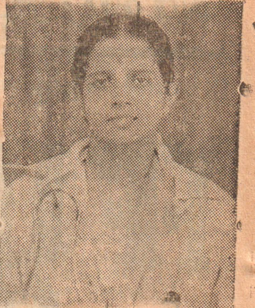
சித்த ஆயுர் வேத வைத்தியர்

ஐரோப்பிய தேச பாதுகாப்பை முன்னிட்டு ஒரு மகா நாட்டை கூட்ட வேண்டுமென்று இரண்டு ஆண்டுகளுக்கு முன்னர் போலந்து வெளிநாட்டு மந்திரி ஒரு பிரேரணையை கொண்டுவந்துள்ளார். இப்பிரேரணையை மற்றைய நாடுகள் ஆதரவுடன் வரவேற்றுள்ளன. செயலினால்தான் முன்னேற்றமடையலாம் என்ற கொள்கைக்கமைய போலந்து தேசம் ஐரோப்பிய பாதுகாப்பு சம்பந்தமான முன்னேற்றத்தை எதிர்பார்த்துக் கொண்டிருக்கின்றது. உலக சமாதானத்தை நிலைநாட்டவும் உலக நெருக்கடியை தளர்த்தவும் போலந்து மேற்கொண்டும் நடவடிக்கைகள் எடுக்கும்.