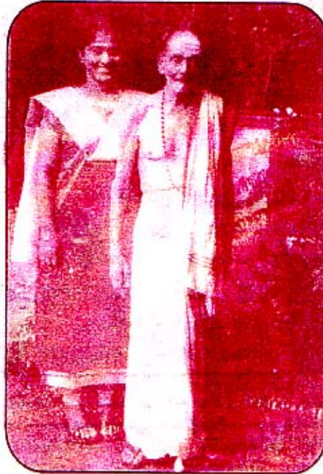
துணைவியாரின் பின் உடனிருந்து உறுதுணை புரிந்துவரும் மருமகள் பிரியதரிசினியுடன்