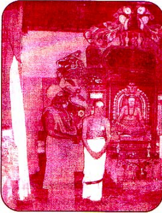
நல்லையாதீனப் பாராட்டு விழாவில் "சித்தாந்தவித்தகர்" பட்டம் பெற்றபோது சுவாமிகளுடன் - 1968