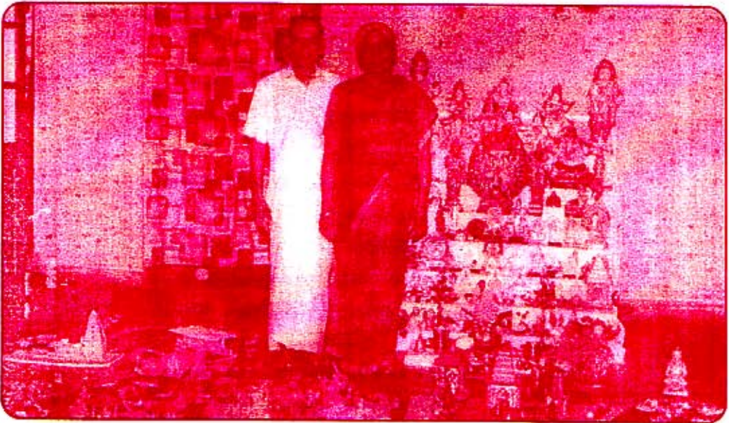
விழா நாயகர் துணைவியாருடன் தமதில்லத்தில் நவராத்திரி கொலுவுடன்