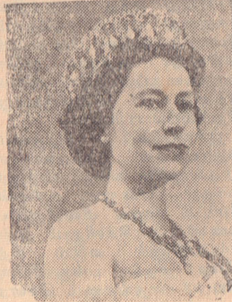
ஆஸ்டிரியாவில் எலிசபெத் மகாராணி

மன்னர் ஹுசேன் நாலர் ஆலோசனை நேற்று ஜோர்டான் மன்னர் ஹுசேன் கெய்ரோவில் ஐக்கிய அரபுக் குடியரசுத் தலைவர் நாஸரைச் சந்தித்து ஆலோசனைகள் நடத்தினார். மேற்காசிய நிலைமை குறித்தும் அரபு நாடுகளின் ஐக்கியம் பற்றியும் அவர்கள் ஆலோசனை நடத்தியதாகத் தெரிகின்றது. மன்னர் ஹுசேன் நாஸருடன் ஆலோசனை நடத்திய பின் சலுதி அராபிய மன்னர் பாயிசலுடன் ஆலோசனை நடத்துவதற்காக அங்கு போகிறார். மேற்காசியாவில் இஸ்ரேல் பகுதியிலுள்ள அரபு எல்லைப்பகுதிகளுக்குப் போய்வந்த வெளிநாட்டுப் பத்திரிகை நிருபர்கள் அங்கு நிலைமை மிக மோசமாக விடுப்தாகவும் இந்த நிலைமை மாறுதுபோனால் மீண்டும் ஒரு பெரிய யுத்தம் ஆரம்பமாகக்கூடிய அபாயம் உருவாக்கப்படும் என்றும் அறிவிக்கின்றார்கள்.