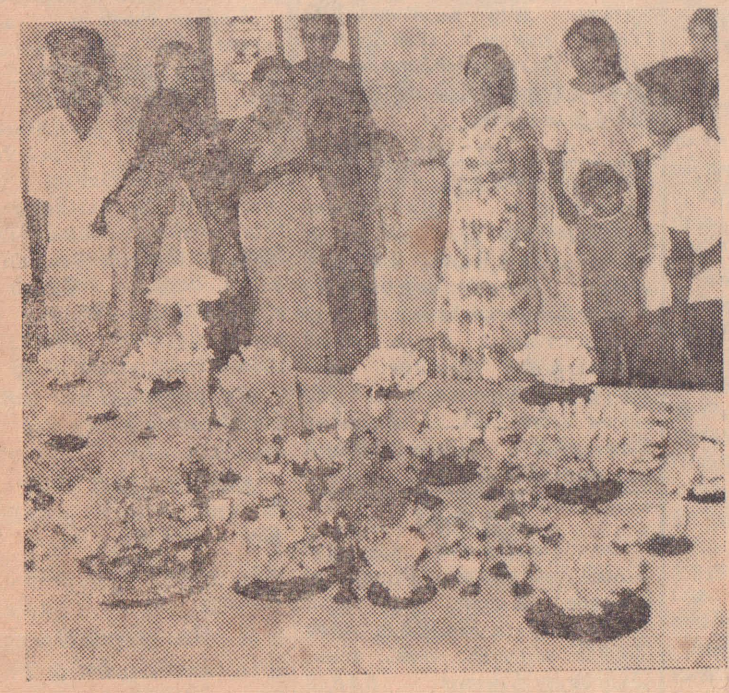
பருத்தித்துறையில் நடந்த கடற்சிப்பிகள் பொருட்காட்சியில் ஒருபகுதி.