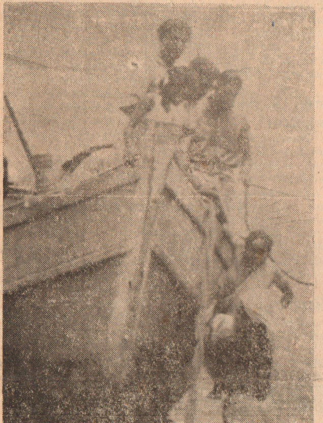
பக்திக்குப் பயமேது. இதோ ஒரு பெண்மணி வள்ளமொன்றிலிருந்து இறங்கிக் கொண்டிருக்கிறார். கீழே கடியல் சாணம் போட்டுக் கொண்டுள்ளார்.