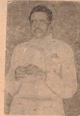
கின் நலிவுகளை நீக்க உறுதியுடன் உழைத்திராவிட்டால் இன்று தமிழ் நாடகக் கலை என்று ஒன்றே இருந்திருக்க முடியாது.