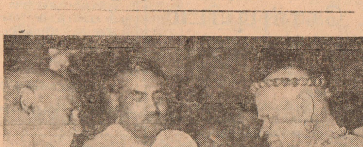
Digitized by Noolaham Foundation. noolaham.org | eelanaaham.org

கையை விட்டு இந்தியா தத்தின்படி 15 வருடத்துக்குள் சென்றுள்ளவர்கள் தொகை குள் ஐந்தேகால் லட்சம் 21,155 பேர் எனக் கணிக்கப் பட்டிருக்கிறது. இவ் ஒப்பந்த வேண்டும்.