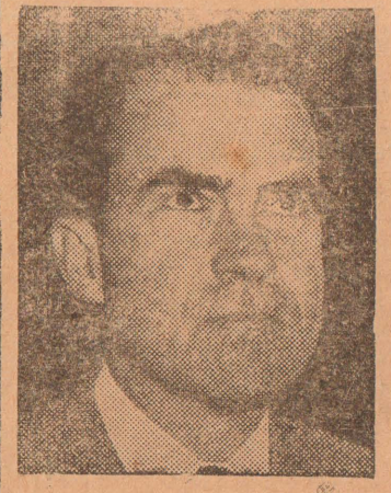
த்து அமெரிக்கா முழுவதும் ஆர்ப்பாட்டங்கள் நடத்தப்படுகின்றன.

நியூயோர்க், நவ. 12 - அதிபர் நிக்ஸனின் வியட்நாம் கொள்கையை ஆதரி