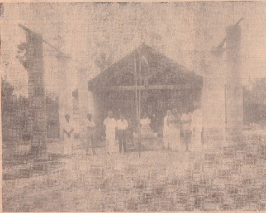
குமாரசுமுருகன் சித்திர வேலுபுத சுவாமி கோவில்