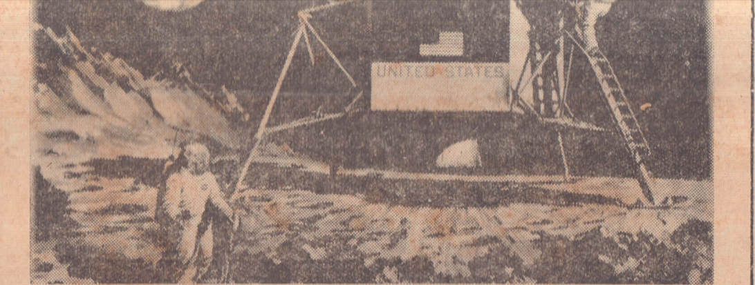
சந்திரனில் இறங்கப்போகும் எட்டுக்கால் பூச்சி போன்ற தாய்க்கப்பலான ‘ஈஜி’ இங்கு காணப்படுகிறது. சந்திரமண்டலத்தில் இருக்கும்போது பூமி இப்படித்தான் சிறிய வட்டவடிவமாகக் காட்சியளிக்கும்

பருத்தித்துறை, புதன் பருத்தித்துறை இ. போ. ச. பகுதி பருத்தித்துறையிலிருந்து நெல்லியடி - கொடிகாமம் ஊடாக மட்டக்களப்புக்கு ஒரு பஸ் சேவையை ஆரம்பித்துள்ளனர்.