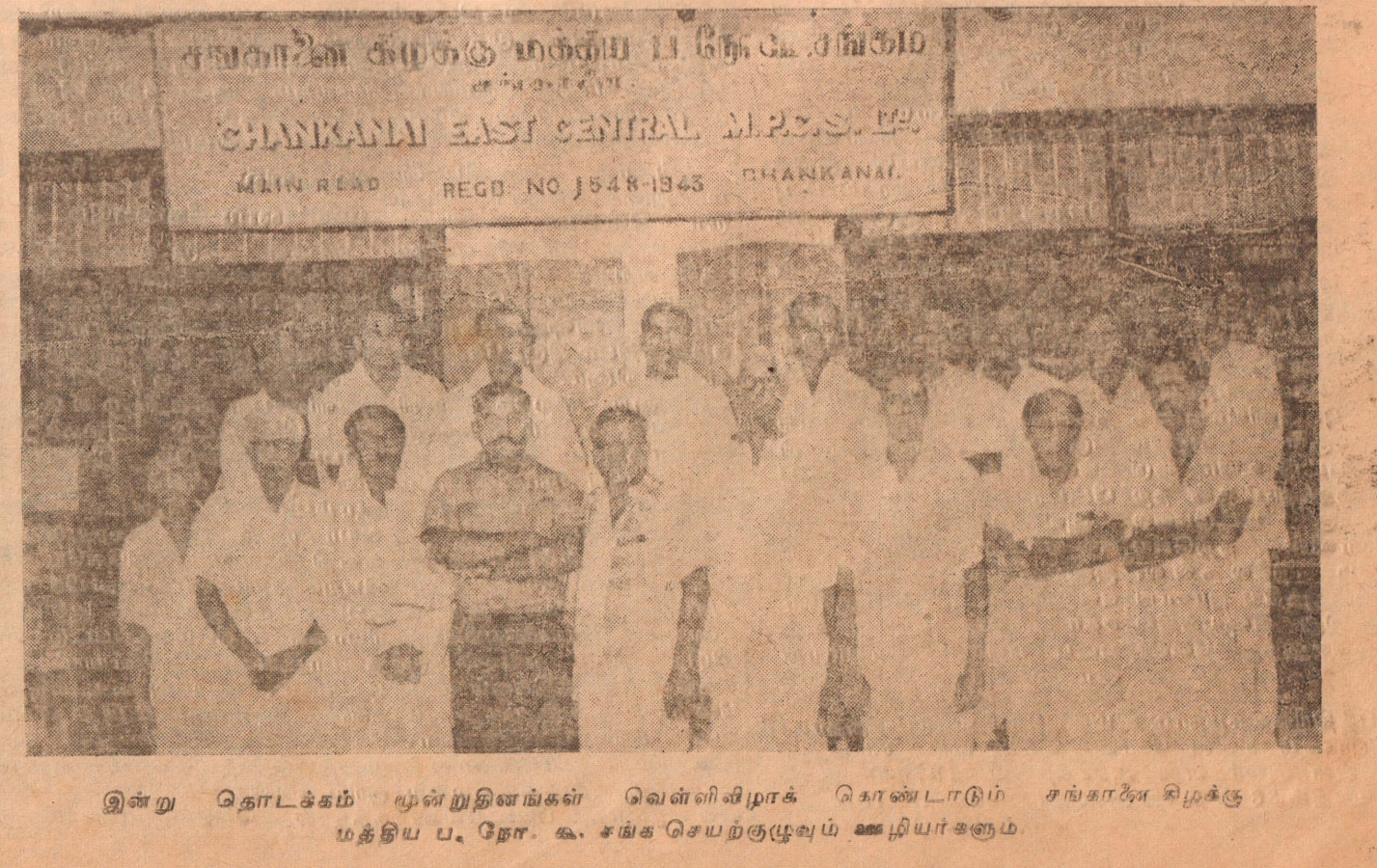
இன்று தொடக்கம் முன்றுதினங்கள் வெள்ளிவிழாக் கொண்டாடும் சங்காலை சிழக்கு மத்திய ப. நோ. கூ. சங்க செயற்குழுவும் ஊழியர்களும்

அல்லைப்பிட்டி, வெள்ளி நயினாதிவு கூப்பன் கடைகளில் கடல்நீரில் நனைந்த வெள்ளைப் பச்சை அரிசியே மக்களுக்கு வழங்கப்படுகிறது. வள்ளத்தின் மூலம் நயினாதிவுக்கு அரிசிஎடுத்துச் செல்லப்படும்போது கடல்நீரில் நனைந்த அரிசியையே இப்பகுதி மக்கள் பெறக் கூடியதாகவிருக்கிறது. இதுபற்றி பொதுமக்கள் நயினாதிவு கிராமசபையினரிடம் முறையிட்டுள்ளனர்.