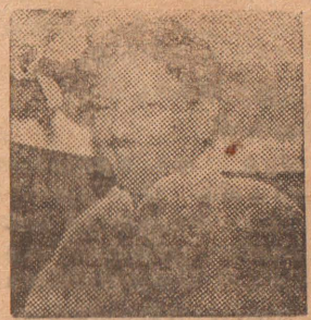
மந்திரி அறிவித்திருப்பதையும் திரு. கருணாநிதி சுட்டிக்காட்டினார்.

புதுடில்லி, ஆக. 27 தனிக்கொடி கோரிக்கையைத் தடைசெய்யும் ஷரத்து எதுவுமில்லை என்று தமிழ்நாடு முதலமைச்சர் திரு. மு. கருணாநிதி இங்கு கூறினார். “தனியாக ஒரு கொடியை நாங்களே தீர்மானித்து வைத்துக்கொள்ள முடியும் ஆனால் அக்கொடியில் தேசியக் கொடியும் இடம்பெறுவதால் தான் மத்திய அரசின் அனுமதியைக் கோர வேண்டியிருக்கிறது. இந்தக் கொடியின் மாதிரி ஒன்றை