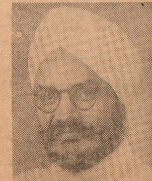
புதுடில்லி, ஆக. 27 இந்தியாவுடன் முறையான உறவுகளை ஏற்படுத்திக்கொள்ள கம்யூனிஸ்ட் சீனா விரும்புமானால் அதற்குத் தக்கபடி இந்தியாவும் நடந்துகொள்ளத் தயாராய் இருக்கிறது என்று வெளி உறவுமந்திரி திரு. சுவரண்சிங் பேசுகையில் கூறினார்.

சீனாவின் பிரசாரப் போகில் சமீபகாலமாக சற்று மாறுதல் காணப்படுகின்றனது. ஆனால் பாரதத்துடனான விவகாரங்களில் மாற்றம் எதையும் காணவில்லை. இந்தியாவுடனான எல்லைப் பிரச்சினைகளை போர் மூலமன்றி அமைதியான முறையில் தீர்த்துக்கொள்ள சீனா முன்வந்தால் மாதிரமே அந்த நாட்டுடன் உறவுகளை ஏற்படுத்திக்கொள்ள முடியும் என்று திரு. சுவரண்சிங் குறிப்பிட்டார். படைபலத்தைக் காட்டிப் பயமுறுத்த எதகனித்தால் பாரதம் தனது பிராந்தியத்தின் ஒவ்வொரு அங்குலத்தையும் காப்பாற்றிக்கொள்ள உறுதியாக இருக்கும் என்று அவர் மேலும் குறிப்பிட்டார். பாகிஸ்தானுடனான உறவுகள் பற்றி திரு. சுவரண்சிங் குறிப்பிடுகையில் பாரத பாகிஸ்தான் மக்கள் அமைதியாக வாழவே விரும்புகிறார்கள். ஆனால் பாகிஸ்தானிலுள்ள தலைவர்கள்தான் எப்பொழுதும் நெருக்கடி நிலைமையை வைத்திருக்க முயற்சி செய்கிறார்கள் என்றார். சோவியத் நாடு வெளியிட்டுள்ள பூகோளப் படங்களில் இந்திய பகுதிகள் சீனாவுக்குரியதாகக் காட்டப்பட்டிருப்பது பற்றியும் திரு. சுவரண்சிங் குறிப்பிட்டார். இந்த விஷயம் குறித்து சோவியத் யூனியனிடம் பல தடவைகள் எடுத்துக் காட்டப்பட்டுள்ளது. இப்பொழுதும் சோவியத் அரசாங்கத்துக்கு இதுபற்றி எமது ஆட்சேபத்தை தெரிவித்துள்ளோம். இந்த விஷயம் சோவியத் நாட்டுடனான உறவுகளை பாதிக்க வேண்டிய அவசியமில்லை என்று அவர் சொன்னார்.