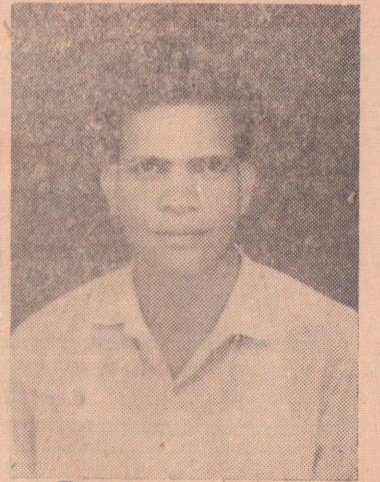
புதிய சமாதான நீதவரன்

சிங்கப்பூர், அக். 22 - பிரபல தமிழ் சினிமா நடிகரும் திராவிட முன்னேற்றக் கழகப் பொருளாளரும் எம். எல். ஏ. யு.மான திரு. எம். ஜி. ராமச்சந்திரன் பத்திரிகை நிருபர்களிடம் அகம்பாவமாக நடந்து கொண்டார் என்று சிங்கப்பூர் பத்திரிகையாளர் சங்கம் கண்டித்திருக்கிறது. ஒரு பத்திரிகை நிருபரையும் புகைப்படப்பிடிப்பாளரையும் மரியாதைக் குறைவாக நடத்தியதாக அவர் மீது இந்தச் சங்கம் குற்றஞ்சாட்டியிருப்பதுடன் இந்தச் சம்பவம் குறித்து வன்மை துரதிருஷ்டமானது என்று டி.டி.பதாரகவும் தெரிவித்துள்ளது. வெளி நாடுகளில் உலகம் சுற்றும் வாலிபன் என்ற திரைப்படத்தை எம். ஜி. ஆர். இப்பொழுது தயாரித்து வருவது தெரிந்ததே. அவர் சமீபத்தில் ஜப்பான் சென்று அங்கு பல காட்சிகளைத் தமது படத்துக்காக எடுத்துள்ளார். எம். ஜி. ஆரின் சிங்கப்பூர் வருகை குறித்து இங்குள்ள பத்திரிகைகள் பிரமாதமான செய்திகளை வெளியிட்டு வந்தன. பத்திரிகை நிருபர்களுடன் ஏற்பட்ட இந்தநிகழ்ச்சி துரதிருஷ்டமானது என்று ஒருவர் கூறினார்.