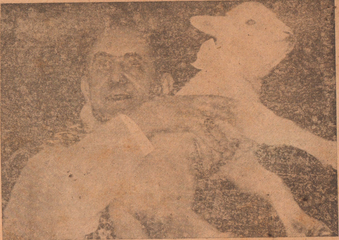
ஆட்டை அன்புடன் அணைக்கிறார் அருட்தந்தை

நத்தாருக்கு நல்லதோர் பரிசு! நீங்கள் நிண்டநாளாக எதிர்பார்த்த யுனிக் போட்டிள் நேடியோக்கள் சிக்கனமான விலையில் விற்பனையாகின்றன. V.K. இராசரத்தினம் 95, ஸ்ரான்லி ரோட் - யாழ்ப்பாணம்.