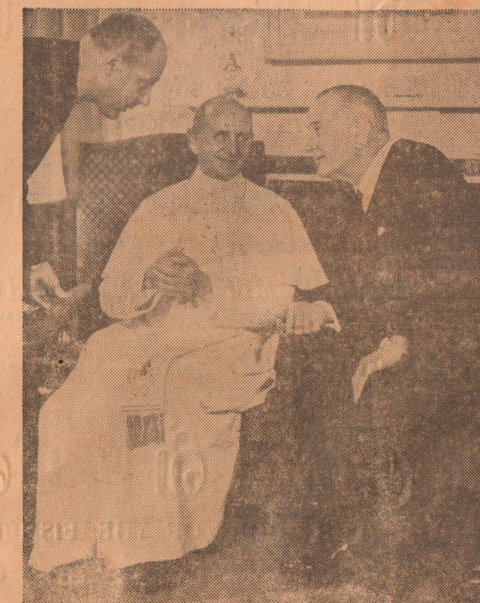
முன்னாள் அமெரிக்க ஜனாதிபதி ஜோன்சுடன் பாப்பரசர்