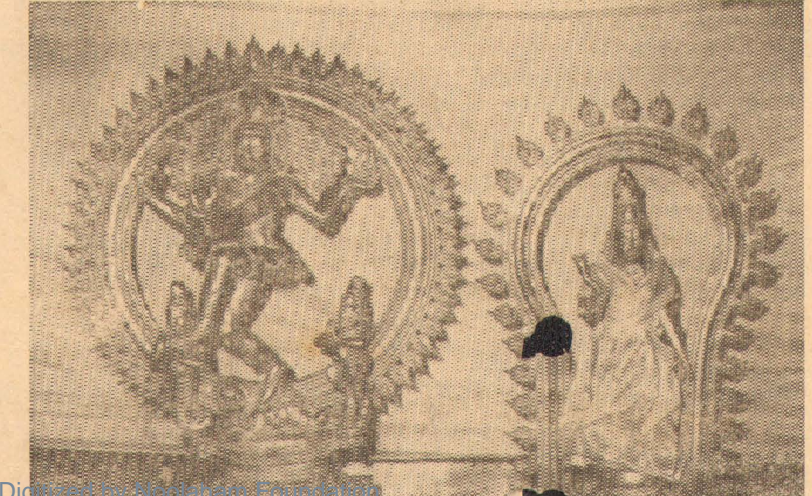
Digitized by eGangotri Foundation, nottingham.org | ari-anaham.org

(1-ம் பக்கத் தொடர்ச்சி) கஷ்டத்தை விளைவிக்கலாமென்றும் சட்ட