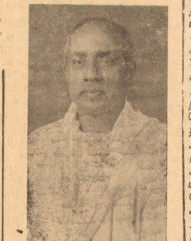
ப. ச. தலைவர் திரு. வயிரமுத்து ஆகியோரும் பேசினார்.

பார்க்கவேண்டும். தமிழருக்குப் போதலுமொழி தமிழ்மொழியாக இருக்கவேண்டும் என்றும் தமிழர் வாழும்மெல்லாம் நீதிமன்றமொழி தமிழாக இருக்கவேண்டும் என்றும் தமீழ் மக்கள் தமிழில் அரசாங்கத்துடன் தொடர்பு கொள்ளக்கூடியதாக இருக்கவேண்டும் என்றும் நாம் வற்புறுத்தி வருகின்றோம். தமிழர் பெரும்பான்மையாக வாழும் பிரதேசங்களில் தமிழிலேயே விசாரணைகள் நடாத்துவதற்கு நியாயவாதிகள் முன்வரவேண்டும். அப்போதுதான் எமது உரிமைகளைப் படிப்படியாக பெறவாய்ப்பு ஏற்படும்.