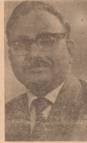
எமது கேள்வியின்படி யாழ்ப்பாண மக்களுக்கு சுமார் 10 லட்சம் ரூபாயிச்சமமாக கிடைத்திருக்கிறது. நாங்கள் சுமார் 13 லட்சம் கேட்டோம். மற்ற ஸ்தாபனம் சுமார் 24 லட்சம் கேட்டது. வேறொரு ஸ்தாபனம் 35 லட்சம் கேட்டது. நாம் மிகக் குறைவாகவே கேட்டோம். அப்படியிருந்தும் நமக்கு சபையின் பூரண ஒத்துழைப்பு கிடைக்கவில்லை.

20,000 மக்கள் அறுத்து தேகமாயிருக்கிறது. வேலைகள் துரிதமாக நடைபெற்றுக்கொண்டிருக்கிறது.