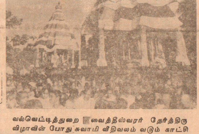
வல்வெட்டித்துறை வைத்தீஸ்வரர் தேர்த்திரு விழாவின் போது சுவாமி விதிவலம் வரும் காட்சி