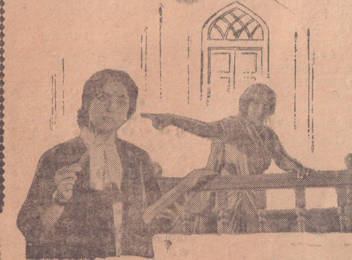
ஸ்ரீ விநாயகா சுப்ரியா கம்பைன்ஸ்