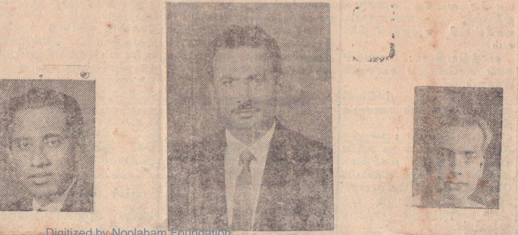
யாழ்ப்பாணம், சனி இலங்கைத் தமிழரசு செயற்குழு தயாரித்தது

வேலணையில் கூடிய தமிழரசு செயற்குழு தயாரித்தது யாழ்ப்பாணம், சனி இலங்கைத் தமிழரசுக் கட்சியின் செயற்குழு நேற்று வேலணையில் கூடியபோது தேர்தல் பிரசாரத் திட்டங்கள் பற்றி ஆராய்ந்ததுடன் கொள்கைவிளக்கப்பிரகடனமும் தயாரித்தது. இம்மாதம் 17-ந் திகதி தொடக்கம் 23-ந் திகதிவரையாழ்ப்பாணக்குடாநாட்டின் பல தொகுதிகளிலும் பெரிய அளவில் தேர்தல் பிரசாரக் கூட்டங்களை நடத்துவதென்று செயற்குழு தீர்மானித்தது. 17-ம் திகதி நல்லூரிலும் 18-ம் திகதி காங்கேசன்குறையிலும் 19-ம் திகதி