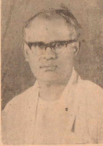
ஆண்டு சட்டக் கல்லூரியில் சேர்ந்து சட்டம் பயின்று கொண்டு சட்டக் கல்லூரி மாணவராக இருந்து கொண்டே 47-ம் ஆண்டு பொதுத் தேர்தலில் சாவகச்சேரித் தொகுதியில் (கிளிநொச்சி உட்பட) அகில இலங்கைத் தமிழ்க் காங்கிரஸ் வேட்பாளராகப் போட்டியிட்டு 10,000 வரை அதிகப்படியான வாக்குகளால் வெற்றி பெற்றார்.