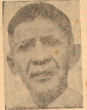
எஸ். டி. பி. ஆர். டி. பண்டாரநாயக்காவுடனும் சரி, திரு. ட. டி. வி. சேனநாயக்காவுடனும் சரி நீங்கள் ஒப்பந்தம் செய்துகொண்டபோது 'சிங்களம் மட்டும்' சட்டத்தை ஏற்றுக்கொண்டீர்களா?

சிறிமா-சாஸ்திரி ஒப்பந்தம் கே: 1948-ம் ஆண்டில் கொண்டுவரப்பட்ட இலங்கை-இந்தியப் பிரஜாவுரிமைச் சட்டத்தை விட சிறிமா-சாஸ்திரி ஒப்பந்தம் தான் மோசமானதென்றும் இந்த ஒப்பந்தத்தை தமிழரசுக்கட்சியினர் ஆதரித்ததனால் ஐந்தே கால் லட்சம் இந்திய வம்சாவழியினர் இங்கிருந்து செல்லவேண்டியிருக்கிறதென்றும் முந்திய பிரஜாவுரிமைச் சட்டத்தின்படி அதிகமானோர் இலங்கைப் பிரஜைகளாகியிருக்க முடியுமென்றும் தமிழ்க் காங்கிரசார் கூறுகிறார்களே இதற்கு நீங்கள் என்ன சொல்கிறீர்கள்? சிறிமா-சாஸ்திரி ஒப்பந்தம்: 1948-ம் ஆண்டில் கொண்டுவரப்பட்ட இலங்கை-இந்தியப் பிரஜாவுரிமைச் சட்டத்தை விட சிறிமா-சாஸ்திரி ஒப்பந்தம் தான் மோசமானதென்றும் இந்த ஒப்பந்தத்தை தமிழரசுக்கட்சியினர் ஆதரித்ததனால் ஐந்தே கால் லட்சம் இந்திய வம்சாவழியினர் இங்கிருந்து செல்லவேண்டியிருக்கிறதென்றும் முந்திய பிரஜாவுரிமைச் சட்டத்தின்படி அதிகமானோர் இலங்கைப் பிரஜைகளாகியிருக்க முடியுமென்றும் தமிழ்க் காங்கிரசார் கூறுகிறார்களே இதற்கு நீங்கள் என்ன சொல்கிறீர்கள்?