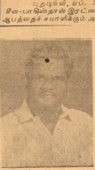
புதுடில்லி, ஏப். 2 சீன-பாகிஸ்தான் இரட்டை ஆபத்தைச் சமாளிக்கும் அளவுக்கு இந்திய ராணுவம் பலம் பெற்றிருக்கின்றது என்று இந்திய பாதுகாப்பு அமைச்சர் திரு. சுவர்ணசிங் கூறியிருக்கிறார். இந்தியா இன்னும் சில ஆண்டுகளில் செயற்கை கிரகங்களை விண்வெளிக்கு அனுப்பும் அளவுக்கு திறன் பெற்றிருக்கும் என்றும் திரு. சுவர்ணசிங் தெரிவித்தார். பாதுகாப்பு அமைச்சின் செலவீனங்கள் பற்றிய லோக சபை விவாதத்தில் திரு. சுவர்ணசிங் விடையளித்துப்பேசினார். இந்தியராணுவம் மேலான பயிற்சிகளும் ஆயுத சாதனங்களும் பெற்றிருப்பதாகத் தெரிவித்த திரு. சுவர்ணசிங் ராணுவத்தின் தாக்கும் சக்தியும் அதிகரித்துள்ளது என்றார். பாகிஸ்தானுக்கும் சீனவுக்குமிடையில் இருந்துவரும் கூட்டுறவைப்பற்றி குறிப்பிட்டவர் இந்தியாவில் கிளர்ச்சிக்காரர்களுக்கு இந்த ஆதரவளித்துவந்துள்ளன வென்றும், ராணுவம் நாட்டைப் பாதுகாப்பதற்கு எப்பொழுதுமே தயாராய் இருக்கின்றது என்றும் குறிப்பிட்டார்.