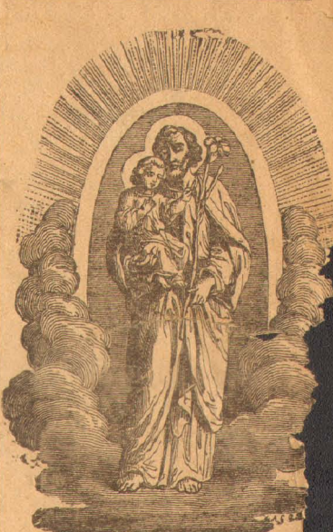
சூசையப்பர் தொழிலாளர் தினம்

மகாவலித்திட்டம் பற்றி கருத்தரங்கு கோட்டை வியாழன் மகாவலித்திட்டம் பற்றிய கருத்தரங்கொன்றை இலங்கை ஒலிபரப்புக் கூட்டுத்தாபனம் தொடராத நடத்தவிருக்கிறது. இத்திட்டம் சம்பந்தமாக எழுப்பப்பட்டிருக்கும் பிரச்சனைகள் பற்றி இக்கருத்தரங்குகளில் ஆராயப்படும்.