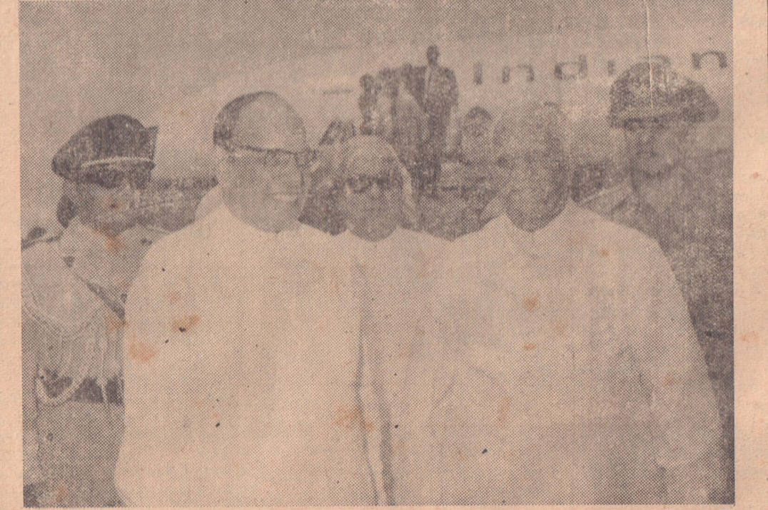
பாரத ஜனாதிபதி திரு. வி. வி. கி. இலங்கை மகா தேசாதிபதி திரு. வில்லியம் கோபல்லவாவுடன் காணப்படுகிறார்.