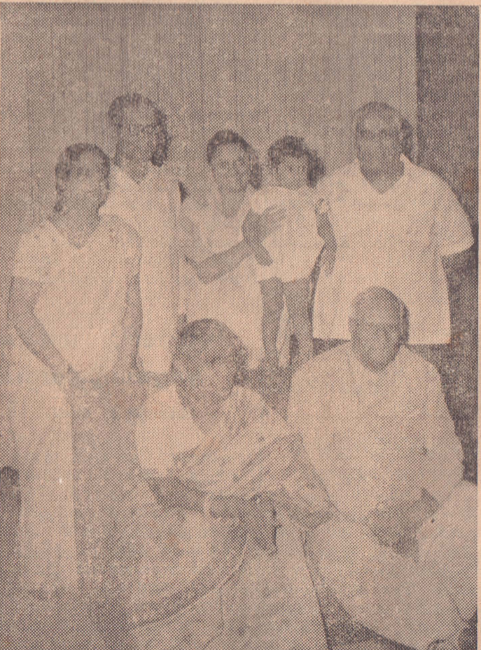
ஜனாதிபதி வி.வி.கிரி தமது குடும்பத்தினருடன் காணப்படுகிறார்

1969-ம் ஆண்டு ஆகஸ்ட் மாதம் 20-ம் திகதி ஜாதிபதியாக தேர்ந்தெடுக்கப்பட்ட திரு. வராககிரி வேங்கடகிரி, தனது கடின உழைப்பாலும், தாய்நாட்டிற்கு ஆற்றிய அரிய பணியாலும் இந்த உயர்ந்த பதவியை அடைந்தார். இந்திய சுகந்திரப்போராட்டத்தில் குறித்த ஜவஹர் லால் நேரு, சுபாஸ் சந்திர போஸ், வல்லபா பட்டேல் போன்ற இந்தியத் தலைவர்களுக்கு இந்நீந்த வசதிகள் திரு. கிரிக்கு இருக்கவில்லை அவர் ஹரோ பள்ளியிலே அல்லது கேம்பிரிஜ் பல்கலைக்கழகத்திலே கல்வி பயிலவில்லை ஓரிஸ்ஸா மாநிலத்திலுள்ள பேராமபூரில் கல்வி பயின்று பின்னர் கொந்தளிப்பான சூழ்நிலையிலிருந்த டப்ளின் பல்கலைக்கழகத்தில் (அயாலாந்து) சேர்ந்துபடித்தார்.