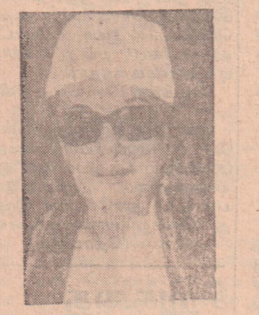
எம். ஜி. ஆர்.

இயற்கைவளம் பூக்கள், பறவைகள், சம்பிரதாயச்சடங்குகள், மங்களச்செயல்கள், வாத்தியங்களையும் கூறும். 'மநுநீதியோ திருநகர், மந்தாரம் பிச்சிமயிலை மருக்கொழுந்து நந்தவனங்கள் நறைவிசம்பூஞ்சோலை, பாட்டிட்டுக் குங்குமத்தால் போந்தநல்ல கோலமிட்டு கூறங்கருவிபுடன் கொம்பு தவில்முழங்க, கொடிபடையும் பம்பையும் சூழப்பவள மணித்தேரேறி' என்றெல்லாம் பாட்டுடைத்தலைவன் பவளிவந்ததை நாம் அக்கண்ணால் கண்டு வணங்கும் வகையில் பாடியுள்ளார். பாடியகாலம் 1647 என்பதைப் பாயிரச் செப்புவாடுகிறது. 'ஆண்டு ஆயிரமும் அபுநாறும் ஆறொழும் பிள்ளும் ஊரை குகும்