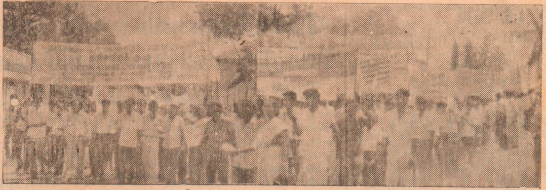
வடபிரதேச தொழிற்சங்கங்களும், அனைத்து வெகுஜன அமைப்புகளும் இணைந்து நேற்று யாழ். நகரில் நடத்திய மாபெரும் ஊர்வலத்தின்போது எடுக்கப்பட்ட படம்.

[யாழ்ப்பாணம்] மயிலிட்டிக் கடற்கரையிலுள்ள ரூரிஸ்ட் ஹோட்டல், இராணுவத்தளமாக்க முயற்சிக்குகிறது. தொடர்ந்து நேற்றுமுன்தினம் தமது இயக்கத்தினரால் குண்டு வைத்துத் தகர்க்கப்பட்டதாக 'தமிழ் ஈழ இராணுவம்' அறிவித்துள்ளது. [மா]