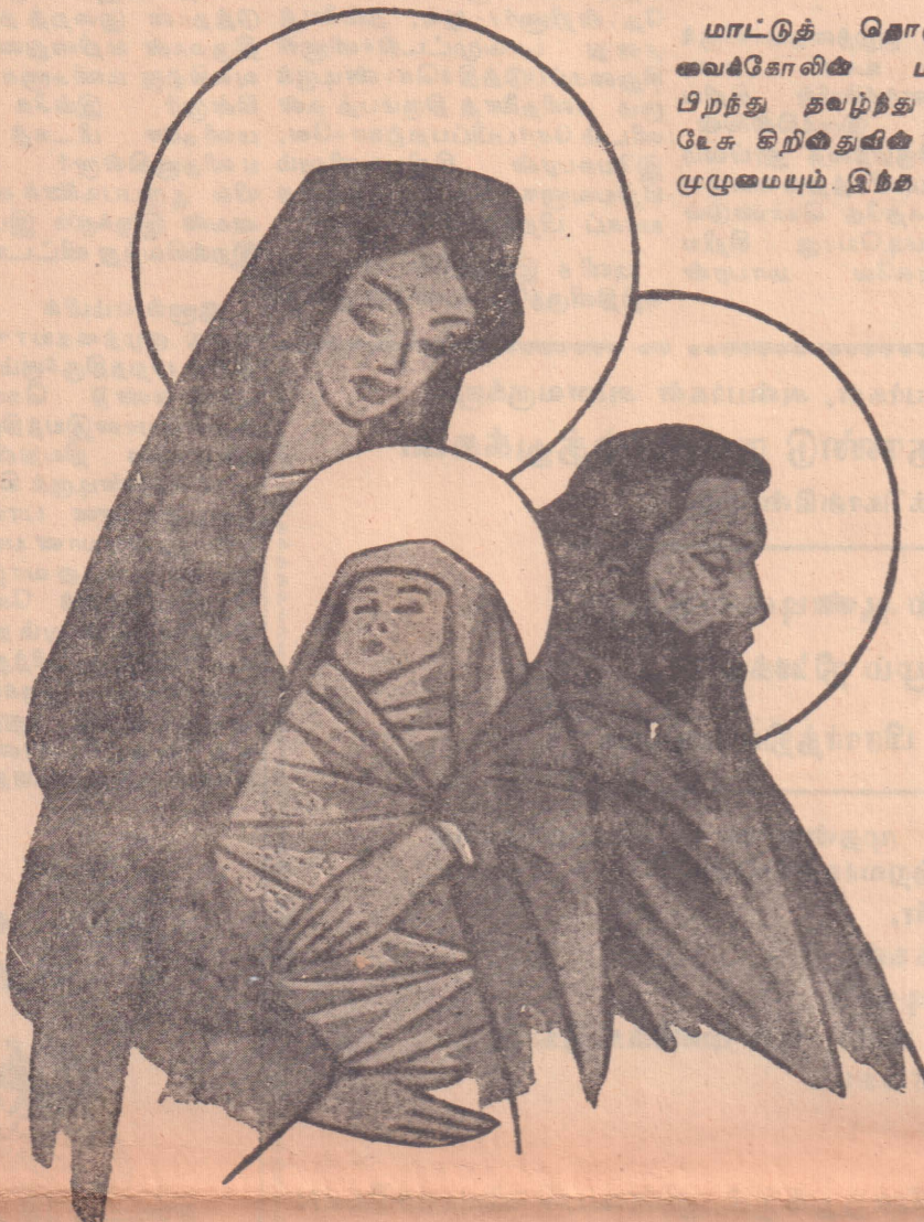
இந்தான் தாழ்த்தகிருவே அவன் உயர்ந்தப்படுவான் என்று.

கறிந்துகொள்ளார், "எவன் பணியையும் பண்பையும் ஒருவன் தக்கித்தான் உயர் அவர் பாராட்டினார். தந்திருவே அவன் தாழ்த்தப் தாம் போதித்த விதத்திடுவாக்கி, எவனெருவன் தக்கி லேயே வாழ்ந்தார்.