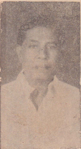
J.J. கிறுகரி (D.K.)