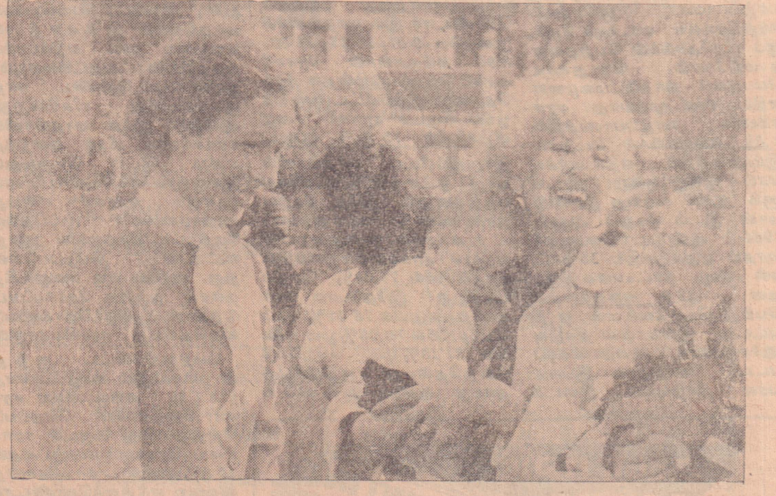
'குழந்தைகளைக் காப்பாற்றுகள்' நிதிபத்திக் தகைவியான இளவரசர் ஆல் [மார்ட் பிவிப்ஸ் சிமாட்டி] தெக் லண்டனிலுள்ள குழந்தைகளுக்கான ரெயினிப்பா பிளேகுப் [Rainbow Play group] என்ற குழந்தைகளுக்கான இல்லத்திற்கு விஜயம்செய்த போது அங்குள்ள உதவியாளர் ஒருவருடன் மகிழ்வுடன் உரையாடுகிறார். 'குழந்தைகளைக் காப்பாற்றுகள்' நிதியம் உலகம் முழுவதும் மேற்கொண்டு வரும் பணிகளைப் பற்றி அறிமதற்காக இளவரசர் ஆல் பலநாடுகளுக்கு விஜயம் செய்துள்ளார். இந்தநிதியம் சயேச்சையான திறவனம், உலகம் முழுவதும் துன்புறும் குழந்தைகளைக் காப்பாற்றும் சேசகி, இனம், மதவேறுபாடுகளுக்கு குழந்தைகளின் நலனுக்கு உதவுவதற்கும் இந்தநிதியம் தன்னை அர்ப்பணித்துக் கொண்டுள்ளது. சுமார் 50 நாடுகளில் பணிகளை மேற்கொண்டு வருகிறது. இந்தநிதியத்தின் சார்பில் டாக்டர்கள், தாதிசை, நகைபுரிபவர்களை மற்றும் பலர் தம்மை அர்ப்பணித்துக் கொண்டுள்ளார்கள்.