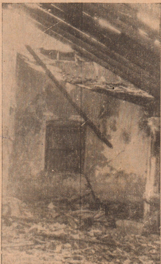
தாவடியில் நேற்று விமானக் குண்டு விச்சுத்திலக் கான தும்புத்தொழிற்சாலை எரிந்து சேதமடைந்த நிலையில் காட்சியளிக்கிறது.

அல்வாய் தெற்கு, தகவல்: கா. செல்வரத்தினம் [C 981]