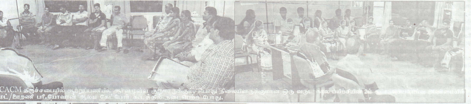
CACM திருச்சபையில் ஆற்றப்பணியில் ஆவமுள்ள குருமாருக்கும், விபாகு நிலையினருக்குமான ஒரு வருட கால பயிற்சியின் 2ம் கட்டத்தில் அண்மையில் மட்டக்களப்பு பரி.யோவான் ஆலய கேட்போர் கூடத்தில் நடைபெற்ற போது.