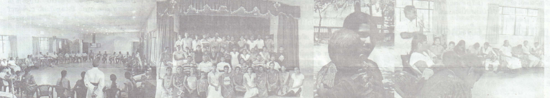
கீழ்க்கு மாகாணத்தில் அமெரிக்கன் சீலோன் மிஷன் திருச்சபையினால் நடாத்தப்பட்ட இல்லங்களிலிருந்து கல்வி கற்று வெளியேறிய பழைய மாணவர்களின் ஒன்றுகூடல் நிகழ்வு அண்மையில் மட்டக்களப்பு பரி.யோவான் சமூகமண்டபத்தில் நடைபெற்ற போது எடுக்கப்பட்ட படங்கள்.