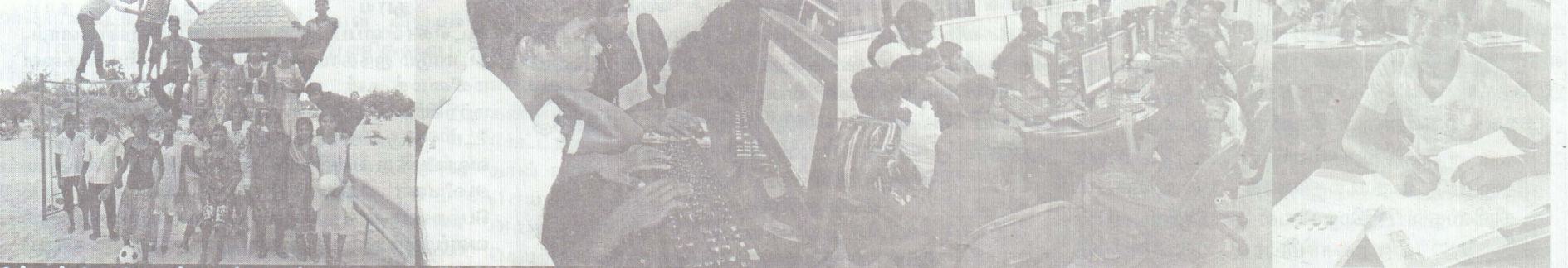
பின்தங்கிய கிராமங்களில் இருந்து தெரிவுசெய்யப்பட்ட பிள்ளைகளுக்கான தங்குமிட வசதிகளுடன் கூடிய 15 நாள் பயிற்சிப்பட்டறை அண்மையில் பரி.யோவான் மையத்தில் நடைபெற்றது. விளையாட்டு முற்றத்தில் பிள்ளைகள் நற்பகையும் கணணிகளில் பயிற்சியளிக்கப்படுவதையும் இங்கு காணலாம்.