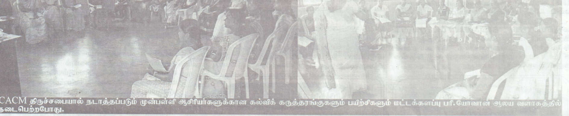
CACM திருச்சபையால் நடாத்தப்படும் முன்பள்ளி ஆசிரியர்களுக்கான கல்விக் கருத்தரங்குகளும் பயிற்சிகளும் மட்டக்களப்பு பரி.யோவான் ஆலய வளாகத்தில் நடைபெற்றபோது.