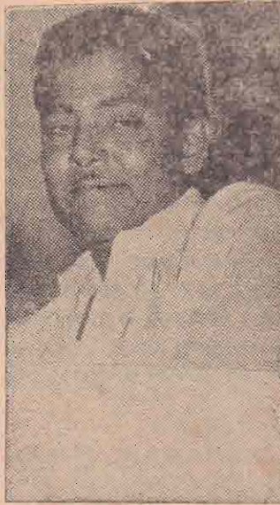
தனக்காக செய்து நம்பாணிக்கு மாற்றிக் கொள்ள

ப: தமிழகத்தில் நல்ல கதாசிரியர்கள் இருக்கிறார்கள். இவர்களின் கதைகளை நான் பத்திரிகைகளில் அல்லவோ படித்துப் பார்த்துக் கொண்டுள்ளேன். அவர்கள் சினிமா பாணிக்கு ஏற்ற விதமாக கதைகள் எழுதவில்லை. இந்தக் கதைகளை நாம்