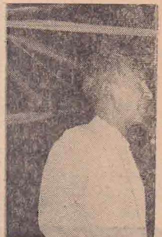
கூறியுள்ளார். மேலும் அந்த அறிக்கையில் அவர் கூறியிருப்பதாவது:

இவ்வகை வாழ் தமிழ் மக்களும், இஸ்லாமிய மக்களும் இந்நாட்டில் கடந்த பன்னூறு ஆண்டுகளாக, ஒரு தாய் வயிற்றுப் பிள்ளைகள் போல, ஒன்றுபட்டு, தமிழ் பேசும் தேசிய இனமாக விளங்கி வந்திருக்கிறார்கள். இவ்வளவு காலமும் தமிழ் மக்களோடு மிக அன்னியானியமாக சேர்ந்து வாழ்ந்து வந்த தமிழ் பேசும் இனத்தின் ஒரு பகுதியான முஸ்லிம் மக்கள் இப்பொழுது தங்கள் பிள்ளைகளுக்கு சிங்களம் படிப்பிக்க வேண்டுமென்று பெரிய