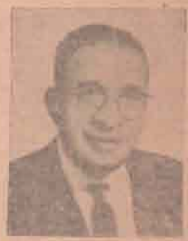
தாம் பத்தாவது தேசிய மாநாட்டில் கல்முனை மாநாட்டில் பேசுவதில் கலந்துகொண்டிருக்கும் பிரதமர்.

“உங்கள் தலைவர் திரு. செல்வநாயகம் அவர்கள் என்னை கெடுவாகப் பாராட்டியுப் பேசினார். ஆனால் அவரைப்பற்றி நான் நன்கு அறிவேன். அவரது நேர்மையையும், போக்கியத்தையும், கண்ணிப்பத்தையும் நம்பித் தான் தேசிய அரசாங்கத்தை அமைக்க அவரது கரத்தைப் பற்றினேன். அதன் காரணமாகத்தான் இன்று மகிழ்ச்சி திளைத்த உங்கள் மத்தியில் இருக்கவும் எனக்கு முடிவாகிறது” இவ்வாறு கல்முனையில் நடைபெற்று இலங்கைத் தமிழரசுக் கட்சியின் 10வது தேசிய மாநாட்டில் பேசிய பிரதமர் திரு. டி.வி.சேனநாயக்கா கூறினார்.